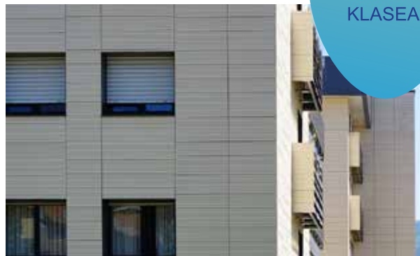
FACHADA VENTILADA AURREALDE AIREZTATUAK

Eskaintzen dizkiguten aireztatutako aurrealdeetan eta SATEan akabatzeke milaka estetiko eta aukera iraunkorrak.